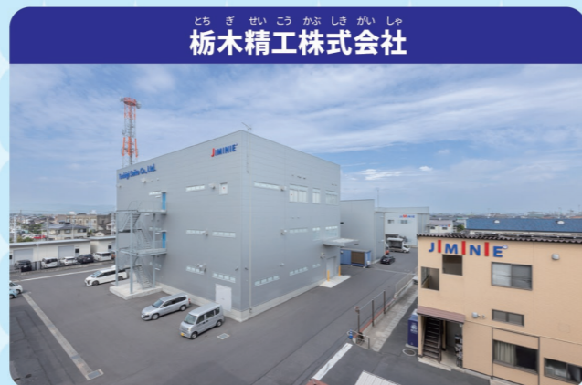
栃木精工株式会社

病院で使われる注射器の針やいりょう器具などはどこでどのようにしてつくられているのでしょうか。また、くらしに欠かせない身の回りの大きなものを支える部品たち、そのせいぞろ工ていを見よう！