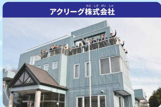
アクリーグ株式会社

IT企業は、インターネットで使えるソフトやアプリをていきょうする会社です。アクリーグは、町や市の役所が管理する土地や家の税金相談、地図の作成、空撮などを行っています。また、空き家問題のかい決や街の照明をLEDにするお仕事もしています。