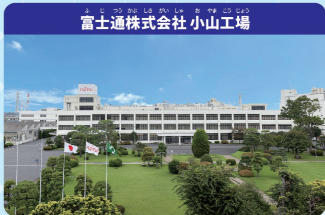
富士通株式会社 小山工場

みなさんがふだん何気なく使っているスマートフォンやパソコンでのやりとり。通信をするために様々なところにネットワークそうちがせっちされています。その製品を作っているのが富士通株式会社の小山工場です。