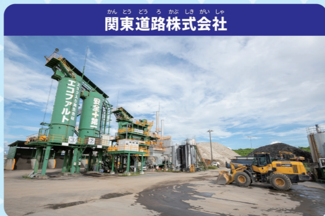
関東道路株式会社

リサイクルとは、使い終わったものをしげんにもどしてせい品を作ること。そのリサイクルをおこなうのがリサイクル工場です。産業はいき物や一般はいき物を回しゅうし、工場に運んだあと、処分場で処分や分べつをしたうえでリサイクルをおこないます。