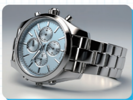
高値がつく高級時計は、物によっては壊れていても大丈夫！