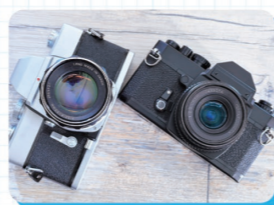
カメラレンズ、フィルムカメラ、ビデオカメラなども持ち込み可。