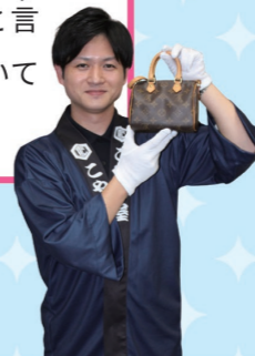
かん定し 店長さん

色々な人にお店のことを知ってもらえるように、インターネットやチラシなどの広こくを作成することが仕事です。どんな文章・動画を作成すれば、多くの人にきょうみを持ってもらえるかを考えて、実さいにさつえいすることが楽しいです！