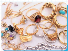
ダイヤなどのほう石、金、プラチナなどの貴金属も買い取ります。