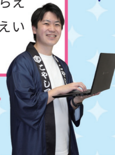
広ほうたん当 ちのピーさん

色々な人にお店のことを知ってもらえるように、インターネットやチラシなどの広こくを作成することが仕事です。どんな文章・動画を作成すれば、多くの人にきょうみを持ってもらえるかを考えて、実さいにさつえいすることが楽しいです！