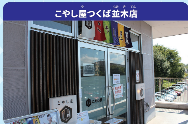
こやし屋つくば並木店

お客様が使わなくなったほう石、時計、バッグなどは、ほかのお客様にとってはおたからになるもの。それらをひつようとすると人に再利用してもらうため買い取るお店です。かぎりあるしげんを大切に使い、はいきされる物をへらして活かす取り組みです。