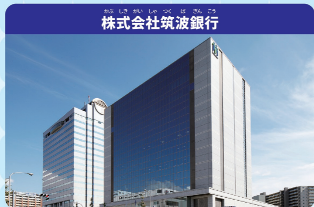
株式会社筑波銀行

お金を預かって管理したり、預かったお金を貸し出したり、離れた場所へお金を送ったりする仕事をしています。また、将来のためにお金を「増やす、残す」ための商品を紹介したり、会社が計画する事業を実現できるよう、よりよい提案をすることも行っています。