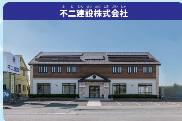
不二建設株式会社

間取りやデザインを自由に決めていく家づくりを「注文住宅」、完成しているお家の中から好きな家を選ぶことを「建売住宅」と言います。注文住宅は、ご家族の理想や夢を聞きながら一つひとつ建てるので、世界にひとつだけのお家をつくることができます。