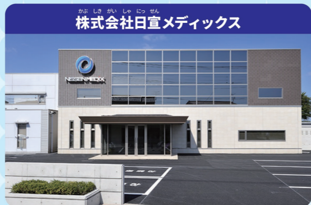
株式会社日宣メディックス

会社やお店の人の「知ってほしい」「伝えてほしい」という気持ちをカタチにして、インターネットやテレビ、雑誌などの「メディア」を使って、たくさんの人にお知らせするお仕事です。そうして出来上がった形が「広告」とよばれています。