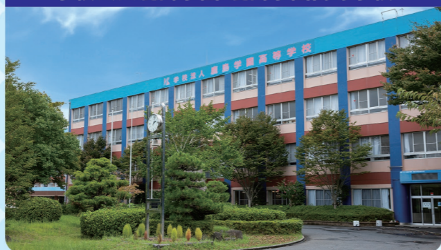
学校法人鹿島学園 鹿島学園高等学校

小中学校とは違ってぎむ教育ではない高等学校。しょうらい何をしたいか、何をすべきか自分で選択できるようになります。みんなが安心して学校生活を送れるようにたくさんの人が生徒を支えています。