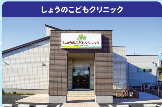
しょうのこどもクリニック

小児科やこどもクリニックでは子どもの病気に くわしい専門のお医者さんが診察してく れます。具合がわるい時は無理せず、お医 者に診てもらいましょう。また、病気を治 すためのお薬を薬屋さんにつくってもら う手続をするのも小児科の先生のお仕事です。