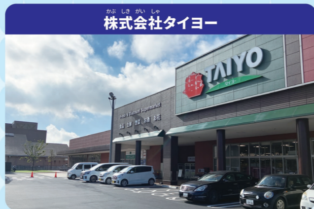
株式会社タイヨー

スーパーマーケットは、私たちの暮らしに欠かせない食料品を主に提供する場所です。そのほか、家庭用雑貨、ペットフードなどもならび、お客様が売り場で自由に商品をえらび集めるセルフサービスの方式で、大量に販売する大きぼ小売店です。