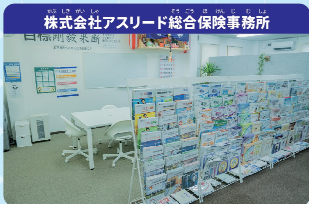
株式会社アスリード総合保険事務所

毎日の生活の中ではいろいろなことが起こる可能性があります。たとえば、自転車でぶつかって人にケガをさせてしまったり、スポーツや遊びの最中に骨折してしまったり。事故やケガ、病気など万が一の時に備えて準備しておくのが「ほけん」です。