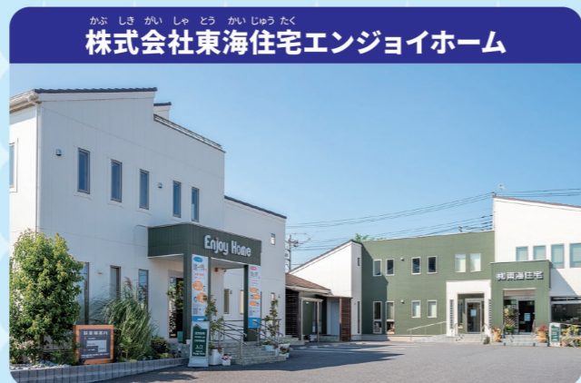
株式会社東海住宅エンジョイホーム

家に関するお話はもちろんのこと、しゅ味や他愛もない会話こそが大事な時間です。お客様のゆめやこだわりが詰まったお家だからこそ、ながくかいてきにくらせないとはいけません。では実さいにどういった方が家づくりにたずさわっているのか見ていきましょう！