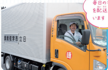
毎日の学校給食を配送・回収しています

みんなにとって身近な、学校給食の配送も行っています。専用の2トントラックを使って給食センターから、日立市内の小・中学校へ学校給食を安全に配送し、回収しています。