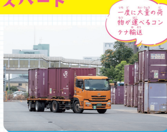
一度に大量の荷物が運べるコンテナ輸送

貨物鉄道を利用し、日立駅から全国各地へ輸送する『コンテナ輸送』を一手に行っています。貨物列車によるコンテナ輸送の特長は、一度に大量の荷物を遠くまで運べることです。貨物列車は時刻表通りに運行しているので、道路渋滞などに左右されず計画的に物を運ぶことができます。また、CO2を減らす地球環境にやさしい輸送方法でもあります。