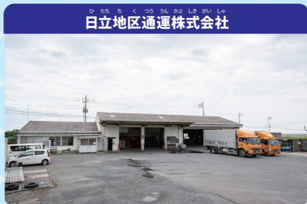
日立地区通運株式会社

創業から80年にわたり、茨城県北部を中心にお客様の物流パートナーとしてビジネスをサポートしています。工業地域であることから半導体や化学工業などの工業製品をはじめ、一般の荷物や建築資材、医薬品、農産物など様々な輸送に対応しているのが特徴です。