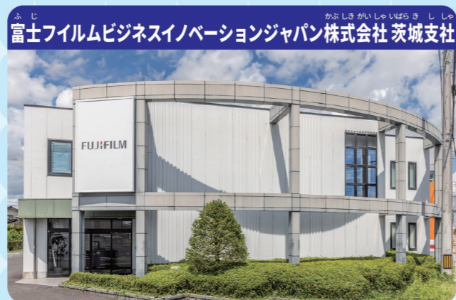
富士フイルムビジネスイノベーションジャパン株式会社 茨城支社

デジタルトランスフォーメーション（DX）とは、普段みんなが使っているスマートフォンやパソコン、タブレットのようなデジタル機器で、みんなの生活や仕事が便利でかいてきになるような仕組みに変えていくことをいいます。