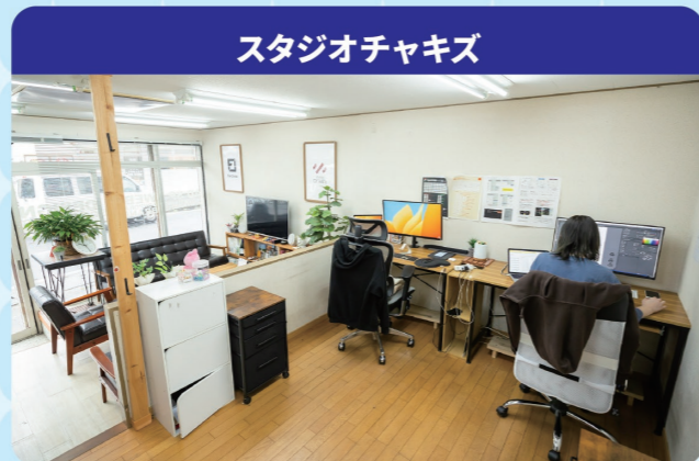
スタジオチャキズ

世の中には服を作るファッションデザイナー、住まいを考えるインテリアデザイナーなど、いろいろなデザイナーが活躍しているよ。それぞれ専門の学校があって勉強できるけど、まずはキレイなものを見たり、絵をかいたりして感性をみがくことも大切だよ。