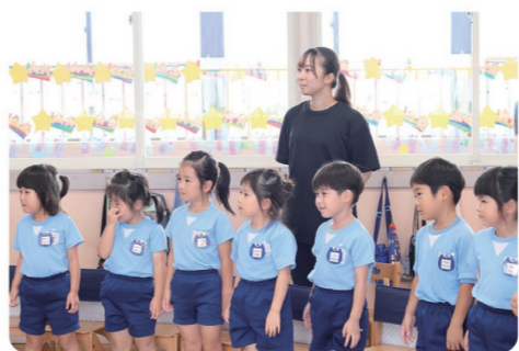
「子どもが好き」という気持ちが大切な仕事です

運動会や、発表会等の各行事、入園・卒園準備など忙しい時期もありますが、職員の情熱が園児と保護者のみなさんの笑顔に繋がったとき、一生忘れられない思い出になります。幼少期の数年間という限られた期間でも人生のお手伝いをしていることが、私達の誇りと喜びになっています。