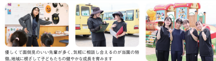
優しくて面倒見のいい先輩が多く、気軽に相談し合えるのが当園の特徴。地域に根ざして子どもたちの健やかな成長を育みます

幼稚園教諭の免許必須。まずはお電話にて園内見学をお申込ください。園内見学の際に履歴書を持参していただければ面接も可。お申込から最短一週間で内定が出ます。見学の他、お仕事体験も受付中です。ぜひ実際のお仕事や園内の雰囲気を体験ください。