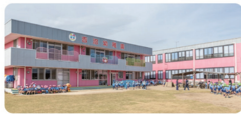
吉沼幼稚園外観写真