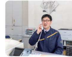
車の予定とおお客様の希望を調整する作業は迅速・的確な判断が必要

日々異なるご要望に最適な提案を行う仕事です。用途や疑問に対する丁寧な説明や、付加価値のある提案が評価されたとき、大きなやりがいを感じます。最初は苦労した国外からのお客様との会話も今はスムーズに。「また利用します」と言われる瞬間が、何よりの励みです。