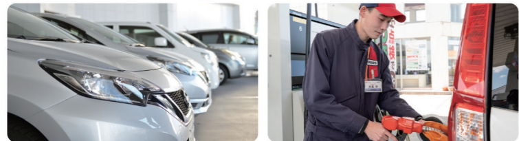
ENEOSブランドの石油製品販売を主力に事業の多角化を進め、堅固な経営基盤を築いています 「地域No.1の接客」によって、多くのお客様に喜んでいただくことが目標です！

創業以来続いている大切な取り組みは、自社の利益を追求するだけでなく、地域にも還元すること。その一環として、水戸芸術館の文化事業への協賛や水戸ホーリーホックのスポンサーを務めるなど、地域に密着した暮らしと文化の向上にも努めています。