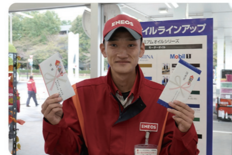
性別や年齢に関係なく人材を評価しているので、若手の男女が活躍中！

社員一人ひとりの意欲に応え、チャレンジの機会を積極提供。新規事業を提案し、社内起業家としてキャリアを描くことも可能です。オリックスリース&レンタカーも社員の発案です。「なりたい自分像に確実に近づく」ことができます。