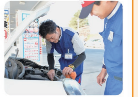
一人ひとりをしっかり見て、個々の能力を評価してくれる会社です

私はサービスステーションの店舗マネージャーを務めており、重要な仕事の一つは人材育成です。一番の目的は、この仕事にやりがいや楽しさを感じて、「ここで働いて良かった」と思ってもらうこと。能力やモチベーションは異なるので、一人ひとりに合ったコミュニケーションを心がけています。