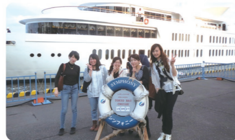
毎年実施している社員旅行。基本は国内の日帰り旅行、3年に1度は2泊3日の海外旅行♪

昇給年1回、賞与年2回、職務・資格・家族手当、社員旅行(海外/国内)、エビナールリゾートクラブ法人会員、中型・準中型免許の取得補助制度など