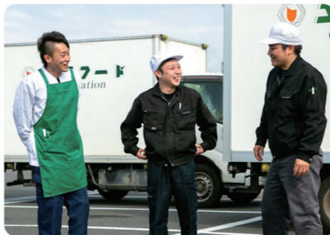
社員同士の仲が良く、助け合える関係性の職場です。社員が一丸となって目標に向かっていきます!