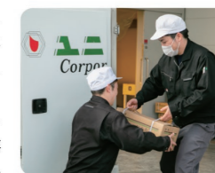
お肉の知識をたくさんつけられそうです!

私は家族がいるので、お肉が安く買えてとても助かっています。時間通りに納品する必要があり、状況によってスケジュールが厳しくなることもありますが、お客様からお肉を褒められたり、いつもありがとうございますと嬉しいので営業力をもっとつけていきたいです。