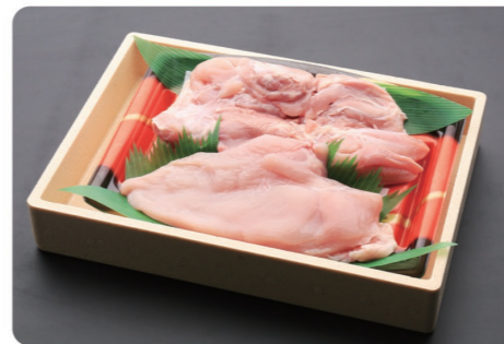
茨城ブランド鶏として飲食店や小売店で展開中。安心・安全で鮮度抜群な美味しさです!

創業より50年以上、時代と共に変化を続けながら地域の食文化を支えてきました。当社の商品は多くの方の生活に欠かせないものです。これからも社員一同で助け合いながらお客様に食の喜びを提供してまいります。