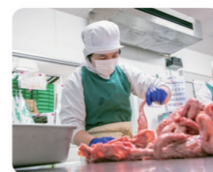
長く安定して働ける仕事です!

条件や待遇が良く、家から通いやすいこともあって入社しました。職場は明るい雰囲気です。先輩方が優しく教えてくれるので安心ですし、この会社でたくさん学ぶことができます。自分たちが携わった食品が皆様に食べる喜びや感動を届けていることにやりがいを感じています。