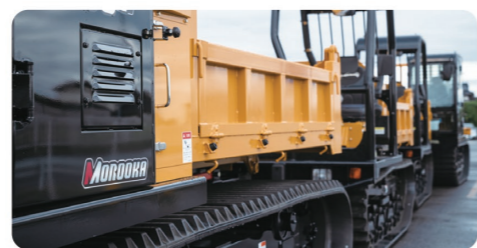
DX推進企業として業界先駆けのプロジェクトにも取り組んでいます！

【工場】本社工場(龍ヶ崎)、美浦工場 【営業所】北海道(苫小牧)、東北(宮城)、関東(龍ヶ崎)、北信越(新潟)、中部(滋賀)、中国(岡山)、九州(熊本)、アメリカ、ドイツ