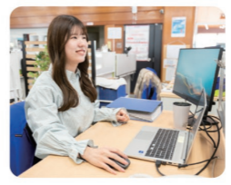
周りの方々に支えて頂きながら、日々の業務に取り組んでいます

売上の計上や売掛金の回収、経費の支払処理などを主に担当しています。特に売上や売掛金の回収は経理の基本であると同時に、会社の業績や経営判断にも関わってきます。そのため、各部門の経理業務担当者やコミュニケーションを取りながら、「漏れなく、ミスなく、素早く」を心掛けています。