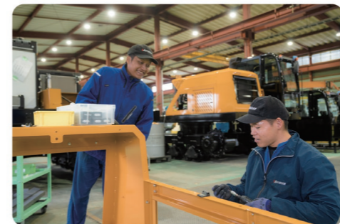
誰もが安心して働けるよう社員の働き方改革を日々実施中。詳しい内容はHPをぜひチェック！

また、当社ではどの仕事にも挑戦できるように、年2度の人事評価とさまざまな教育研修によって各々に合ったキャリアプランを用意。社員が丸となって世界へ諸岡の道を作り上げます。