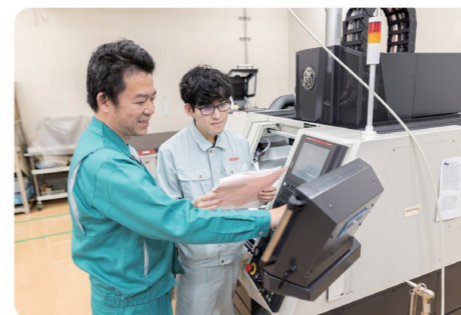
最新機器+社員の技術力が高品質の製品を作ります

当社では「4Hでチャレンジ、基礎加工技術の発信工場を目指す」を掲げています。4Hとは「Heart」「Hand-made」「Hi-speed」「Hi-tech」の頭文字を取ったものです。Heartとは、お客様を思う心と仕事に対する情熱を持つことです。Hand-madeは日本人の器用さと職人気質によるものづくり、Hi-speedは無駄のない動きと物事が素早く進むシステムづくり、Hi-techは進化し続ける先端技術の研究、先端機器を使いこなせる社員による有効活用を意味しています。この4Hを当社の武器として妥協のないモノづくりにチャレンジしていきます。今後は世界を市場に技術発信工場としての立ち位置を確固たるものにしていきます。