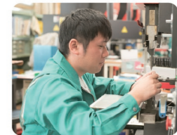
最新機器+社員の技術力が高品質の製品を作ります

私の担当はお客様のご要望に応じて、板を曲げて要望の形にしていける仕事です。小さいものはピンセットを使って曲げることもあります。もともとモノづくりが大好きで、趣味を仕事にできて毎日楽しく働いています。実はそんな私は文系出身です。モノづくりが好きな方なら文系出身でも活躍できます！