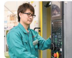
最新鋭の機械設備を若手でも操作を任せてもらえます！

主にマシニングセンタという機械でお客様の要望に沿った形を製作しています。プログラムから加工まで1人で作ることができるのが面白いです。多品種少量生産のため、日々飽きがないのも良いところだと思います。7年目になった今では複雑な形を頼まれるようになって嬉しいです。