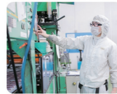
正確に、効率よく！最新鋭の設備とオペレーターの技術でニーズに対応

製造容器の型替えをする際、時間短縮を目指して効率よく動くイメージトレーニングをしています。実作業の前に、あらかじめ作業内容を頭に入れておくことで、スムーズに動くことができるからです。一つ一つのことに目的意識を持ってチャレンジし、目標通りに動けた時には、達成感とやりがいを感じます。