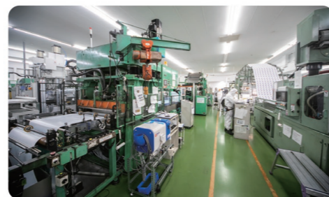
PP、PET、HIPS、PPF、PSなどさまざまな素材に対応可能な製造ライン