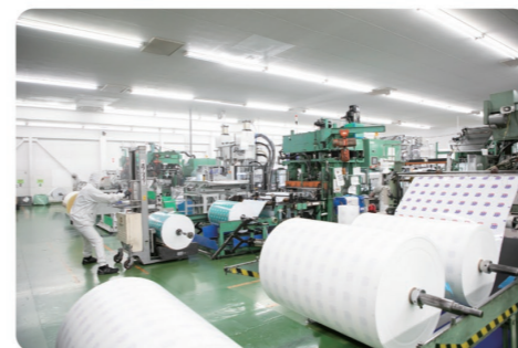
食品パッケージは徹底した品質管理・衛生管理の下で製造されています

当社は外国籍の方も多く、現在7カ国の方が働いています。実力があれば正社員はもちろん、役職登用も用意しています。また、遊びや学びも大切なものと考えていますので、今後は他工場の見学ツアーやBBQの実施も検討しています。