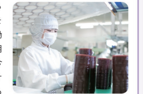
検査機器も導入しながら、徹底した品質管理で高いクオリティを実現

日本の4年制大学に通い、卒業したら日本の会社に就職して様々な経験を積みたいと思っていました。就職活動中に友人からの紹介で、外国人の雇用も積極的にしていると知りました。今後は私がベトナムからの実習生をサポートできるように頑張って、自身も成長しながら会社に貢献したいと思っています。