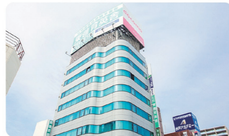
東進育英舎水戸校外観