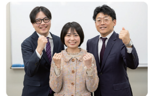
一流の人財を育てるために一流のスタッフが揃っています

また、スタッフ達にとってワークライフバランスが整った企業であるために、福利厚生も充実。各種研修のほかに、年に1回の海外研修を実施。これまでにバンクーバーやニューヨーク、上海などさまざまな国を訪れました。休日はシフト制で、社員一人ひとりがモチベーション高く働けるような環境を用意しています。明るい仲間達に囲まれながら、元気に楽しくそして、生き生きと働ける職場です。