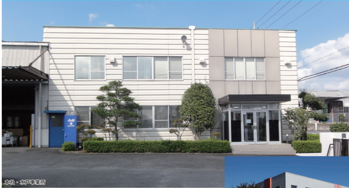
本社・水戸事業所

●事業内容/試薬・半導体製造用薬品・化学工業用薬品販売、理化学機器・計測機器・理化学機材等の販売 ●資本金/2,000万円 ●売上高/46億6,400万円(2023年度)