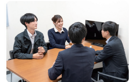
同年代が活躍する会社だからこそ、お互いの意識向上にもつながっています

何が起るか分からない混沌とした時代に入っています。有事の際にも素早く対応し、お客様のお役に立てるよう、これからも取扱い分野、アフターフォローの品質向上も含め、さらなる企業発展を果たしていきます。