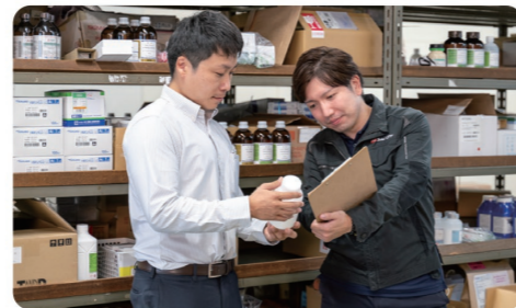
分からないことがあっても、気軽に相談できるから安心!