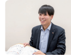
色々な業界の方と知り合うことができました!

入社したばかりの時は、化学業界・製品についてわからないこともありましたが、営業活動では、メーカーさんと同行してお客様訪問する機会も多々あり、その場で多くのことを学び、実際に自分自身で提案したものが採用いただいた時や新たな仕事につながった時に一番やりがいを感じます。