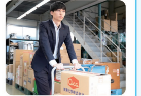
会社見学をした際、社内の雰囲気良かったので入社を決めました

食品、化学、製薬、環境系の幅広いジャンルの企業や大学・研究機関等の官公庁で働く方々に向けて、主に研究で使用する試薬や理化学機器類、装置類を販売しております。お客様の研究や製造の進捗に影響する責任重大な役目を担っているため、常に品質・納品スピードを意識して働いています。