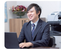
最近では職員間の親睦目的で部署対抗のバレーボール大会を企画！

病院の広報活動や院内イベントの企画、年間行事のスケジュールリングをしています。院内外の人との繋がりが多いことや、遂行した仕事が記録に残ることにやりがいを感じます。また、地域の皆さまに当院を知ってもらうために、広報誌の作成やメディアへのプレスリリース作成に力を入れています。