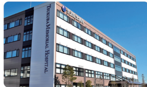
つくば市の中心に位置し、地域に根ざし、地域の人々によって育まれてきた病院です

資格取得支援制度、茨城県女性が輝く優良企業認定制度取得、職員食堂、附属施設利用料職員割引、ユニフォーム貸与、互助会、自転車通勤可(無料職員駐車場有)、電車通勤可(駅からの無料職員送迎バス有)、医療費減免制度、職員旅行、法人忘年会、職場対抗バレーボール大会