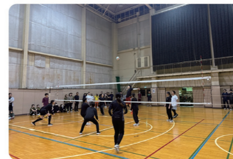
理事長杯バレーボール大会は多くの職員が参加して楽しみ、熱く大盛況！職員同士のコミュニケーションも深まりました

人々の暮らしを支える病院には専門知識や技術を持って医療現場で患者さんと向き合う職員のほか、その職員を支える環境整備や受付・事務処理を行う部署など、大勢の職員が働いています。入職後は新入職員研修や医療安全管理研修などを受け、スキルアップに伴う研修も用意され、必要な資格取得のための支援制度もあります。また、女性のためのキャリアアップ研修や女性職員がやりがいをもち働き続けることができる職場環境づくりを推進する「茨城女性が輝く優良企業認定制度」を取得。もちろん福利厚生も充実。医療費減免制度や職員旅行、忘・新年会、バレーボール大会などスポーツや楽しいイベントも！地域や社会に貢献しながら、自身も成長できる環境が整っています。