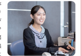
入職後の環境も相談しやすい雰囲気、楽しく働いています！

専門学校時代に実習で訪れ、業務を体験しました。職員の患者様への気配りや対応の丁寧さ、職員同士の雰囲気や明るかったのを覚えています。実習での質問にも笑顔で答えていただき緊張がほぐれました。私もここで患者様を安心させられるようなスタッフになりたいと思ったのが志望動機です。