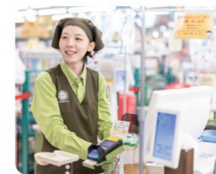
初めての方も常連の方にも接客をしているのが楽しいんです！

レジの接客をはじめ、サービスカウンターで対応したり、レジの作業割り当て表を作成しています。自分の担当する作業のほか、パートさんの作業管理などのバックアップも大切な業務です。当社の社員を大切に「人財」という考え方が好きで、上下の壁がない関係性も大きな魅力に感じます。