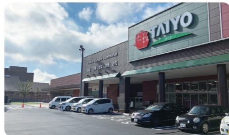
千葉・茨城・東京でスーパーマーケットチェーンやリカーショップを42店舗展開しています

新入社員導入研修、新入社員フォロー研修(3・6・9・12ヶ月)、各種階層別研修(中堅社員、主任、次長、店長等)、部門別研修、社外研修(ペガサスクラブ、CGCグループ、SMBC定額制クラブ等)