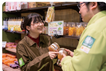
社員間のコミュニケーションも円滑で、現場での作業指導も丁寧に行われているので安心です