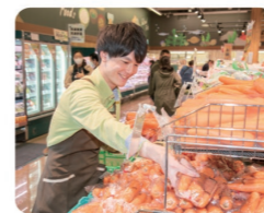
自分で売場を作り上げ、販売計画を立てるのも面白いです

青果部門として野菜や果物の陳列・販売のほか、お客様のお買い物のサポートもします。発注業務等の商品管理を行いつつ、主任として人員管理や全体の1日の流れをコントロールするのも私の仕事です。スーパーマーケットに食品等が陳列、販売されるまでのプロセスが知れることは面白いと思いますよ！