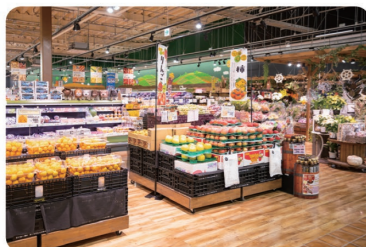
産地と食卓を結ぶ旬の青果をはじめ、新鮮で豊富な品揃えでお客様に強く支持されています

また、低価格でありながら、安全・安心な商品をお客さまにお届けする「まごころを食卓へ」をモットーに、自社開発商品の開発にも積極的に取り組んでいます。特に添加物の少ない原材料にこだわった惣菜やベーカリーなどの自社製造商品を強化し、品のある安さの実現を目指しています。これからもお客さまにとって地域にあって良かった会社であることはもちろん、社員がタイヨーで働いて良かった、と思うような働きやすい職場環境づくりを推進します。スーパーマーケットは地域にお住まいの方の命を守るライフラインの一つでもあります。その使命に誇りを持って、これからも地域の一層の発展に貢献していきます。