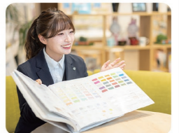
会社の支援を受け、宅地建物取引士の資格取得にチャレンジ中です

幼少期に両親が家を建てた際、住宅メーカーや家具・家電店を何度も訪れ「家を建てる＝お金以外でも大きな買い物」だと実感したことが、住宅業界への興味のきっかけです。入社後は一人ひとりをちゃんと見てくれる環境の中、社長の人柄や社風、円滑な人間関係に恵まれ楽しく仕事をしています。