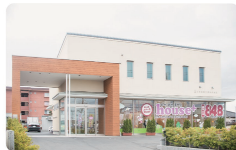
勝田駅前の昭和通り沿いにあるhouse+ひたちなか店