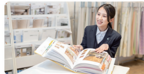
住宅のプロ集団が親身になって皆様の家づくりをサポートします