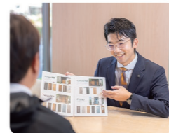
仕事の面白さと大変さ、その両方が自分を成長させてくれます

以前は全く別の地で、別の仕事をしていましたが、会社説明会で伺った社風に惹かれ入社しました。社長のお話が自分に合っていると感じ、即入社を希望。実際、未経験者の私を温かく迎え入れてくださり、非常に働きやすい雰囲気を感じました。未経験でも、確実にステップアップできる会社だと思います。