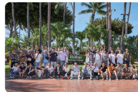
2019年の社員旅行の様子(ハワイ)

ハワイやグアム、沖縄など、その時に応じて社員旅行を企画しています。ショッピングやアウトドアなど、各々楽しい時間を満喫して、この時だけは仕事のことを忘れてリフレッシュタイム！