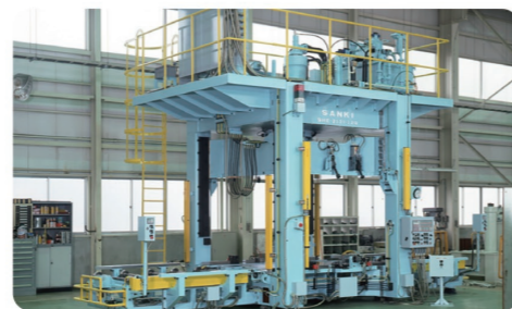
最新技術と豊富なオプションであらゆる生産工程をサポートする、自動車関連及び各種生産用プレス

特別休暇制度、各種生命保険、作業服支給、昼食費補助制度、国内・海外社員旅行、永年勤続表彰制度、各種祝金・見舞金