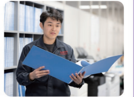
もっと設計を勉強して、自分にしかできない設計をしたい！

自分の裁量で仕事を進められて、様々な人とコミュニケーションを図れるところです。設計の仕事が終わらないと他部署の仕事が進まないため、早く終わらせるのはもちろんですが、品質を落とさないように、スムーズに組立作業が進むよう考えながら仕事を進めることに面白みを感じます。