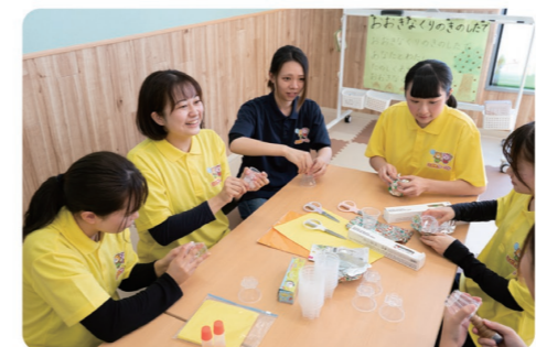
新卒者から子育て経験を持つキャリア採用者まで、個性豊かな職員が力を合わせてこどもたちに寄り添う支援を行っています

こどもサークルを利用するのは、様々なバックグラウンドを持ったこどもたちです。大切なのは、繊細で敏感なこどもたちに安心感を与えられるやさしい笑顔や、こどもたちと同じ目線に立って思いやりのある支援をすること。だからこそ、知識や資格より人柄と意欲を大切にしています。