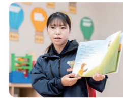
一人ひとり個性は異なるので、日々学びと発見の連続です!

個性に合わせた支援を考え、出来なかったことが出来るようになった時にやりがいを感じます。出来るように強要するのではなく、その子のペースに合わせて、一つずつ出来るようになるよう心がけています。日々の支援を通して、こどもたちだけでなく、私自身も成長できていると実感します。