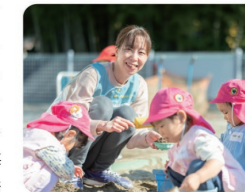
成人した後も遊びに来る子ども達との交流も楽しい職場です

業務に追われる時もありますが、子ども達の日々の成長を間近で感じることができ、やりがいや達成感はとても大きいです。舞い散る桜の花びらを「追いかけてこして」と思ってもみない発想や言葉が飛び出してきたり、毎日違う表情が見られたり、自分も一緒に楽しみ、感動、成長できる仕事です。