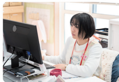
従業員が心身ともに健康で働ける、かつパフォーマンスを最大限發揮できる環境です

働きやすさを追求する職員ファーストの当園は、福利厚生にも力を入れています。社会保険や労働保険の給付金の申請手続きなど、提携する社会保険労務士が正確、スピーディーに対応。保育は健康が資本なので、健康診断や予防接種の補助なども行っています。