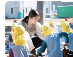
当園の特徴は行事が多め。子ども達とたくさん思い出を作れます

保育士の夢を持ったのは、自分が年長の時です。その時の担任の先生に憧れて、保育士になりたいと思うようになりました。高校でも保育科に進み、大学で資格を取り、そして憧れの先生と一緒に働きたいという思いから、自分が卒園したかつらぎ保育園への入職を決めました。