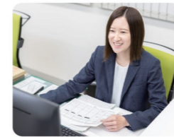
伝票の発行や入金確認といった経理や労務などを担当しています

会社見学の際、コイルセンターの迫力と活気ある雰囲気がとても印象に残りました。福利厚生が充実している社員を大切にしている姿勢や、海外への社員旅行も魅力的でした。実際に働きやすさや居心地の良さを実感しているからこそ、2度の産休・育休を経て復職し、現在は時短勤務をしています。