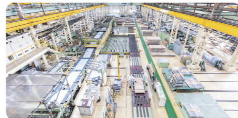
需要の高い「鉄」の中でも表面処理鋼板を専門に扱う切断工場を併設し、多様なサイズへの加工と短納期を実現

メディカルサポート(健康診断・人間ドック・婦人科検診・予防接種)、研修旅行(ニューヨーク・シドニー・ウィーン他)、資格取得支援金・子育て支援金、飲料水飲み放題