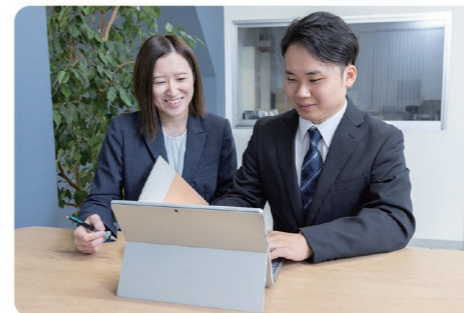
安心と安全はもちろん、快適に働ける環境づくりを大切に。和やかな雰囲気から円滑なコミュニケーションが生まれやす

また、熱中症対策をきっかけに始めたフリードリンク制度は、構内の自販機がなんと一年中無料で飲み放題!夏はアイス、冬は使い捨てカイロも無料で配布しています。社員食堂のメニューにはカロリーや糖質、脂質などを表記し、健康づくりに配慮するとともに日替わりランチ430円という嬉しい価格も好評。国内外への社員旅行も全額会社負担です。