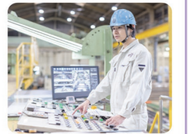
機械の操作を覚え、ひとりで作業できたときに成長を感じます

コイル状の鋼板を平らにし、お客様の指定サイズに切断加工する大型ラインを統括するオペレーターを担当しています。ラインに携わる様々な仕事を経験し覚えた事が強みであり、若いうちにチャンスをもらえる事にやりがいを感じています。最年少のオペレーターとして、この技術を後輩にも教えていきたいです。