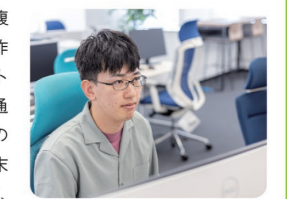
若手も安心して積極的に成長できる環境が整っています！

バーチャルと現実が融合するMR(複合現実)の技術を活用して、現場の作業員を遠隔地から支援するソフトウェアを開発しています。これまで通信インフラや電線の保守点検などのアプリを手がけ、試行錯誤を重ねた末に実装した機能がお客様に喜ばれて、やりがいと自身の成長を実感できました。