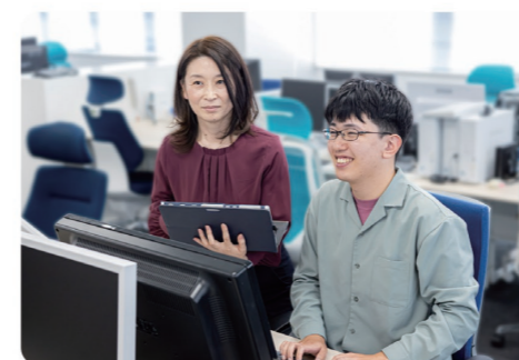
社内の服装は私服がベーシック。上下の壁がなく、若手でも活躍できる風通しの良い社風です

ソフトウェアの開発・保守やネットワークの構築・運用管理、セキュリティサービスの提供など、当社の業務内容は幅広く、IT技術者としてのスキルを身に付けやすい環境が整っています。さらに、NTTグループの一員として安定した経営基盤や充実の福利厚生を誇りつつ、一人ひとりの意見を生かせる企業規模であることも大きな特徴です。お客様とともに仕様を検討し、力を合わせてソフトウェアの開発やシステム構築をする「アジャイル開発」は、柔軟さと機動力がカギ。スピード感あふれるサービスをクライアントに提供します。当社が目指すのは誰もが自ら考える力があり、チームの仲間やお客様とコミュニケーションのとれる集団。時代を牽引できる次のIT技術者を生み出していきます。