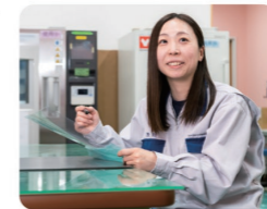
産休・育休制度も活用でき、女性でも働きやすい環境です！

母校の恩師に新会社立ち上げを紹介され、新しい挑戦に惹かれて入社しました。入社当初は機械や品質も手探りで、工場の仲間と毎日相談しながらお客様の要望をどう実現するか試行錯誤していました。その日々の苦労も、今となってはいい思い出です。