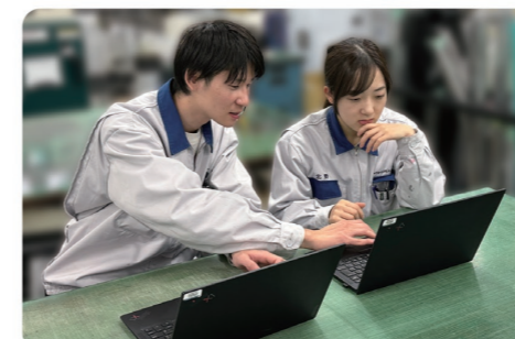
資格支援制度として試験費用を会社で全額負担しているため、仕事に必要な資格取得をサポートしています。

一つ一つの素材だけでは何かしら不足するものがありますが、衝撃や太陽の光などにも強いアクリルの層と金属が貼ってある層を合わせることで、耐久性と金属による高級感を実現しました。さらに接着剤を着色することで色も豊富となり、幅広い表現を可能にしています。