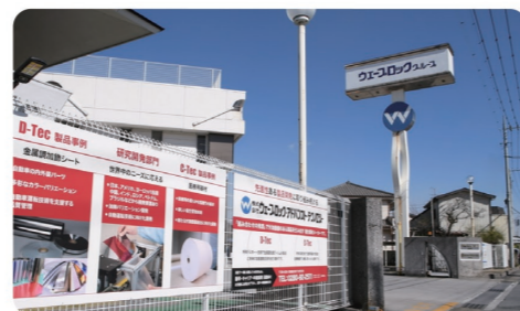
生産の拠点となっている古河工場。車のエンブレムなどにも当社の技術が採用されています！

厚生年金、健康保険、雇用保険、社宅支援制度、財形貯蓄制度、慶弔見舞金、社員持株会、健康保険組合の保養所利用、全国でさまざまな優待が受けられる福利厚生サービスに加入