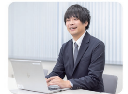
様々な業界への知見が広がり、新しい世界に出会える仕事です

主にWeb広告の運用や、営業と同行してクライアント様の要望をヒアリングし、広告プランの提案書を作成したり、Webマーケティングの課題に対して戦略を考えたりしています。その他にも、自分でチラシやバナーの制作を行うこともあり、反響を得られた時は大きなやりがいを感じる事ができます。