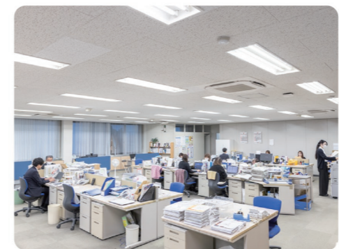
オンライン、オフライン問わず幅広い広告戦略でクライアントのビジネスをサポートしています

例えば、近所の店のセール情報が載る広告を手にとってお得な気分になり、多くの客が押し寄せた店が新たなチャレンジをする。そして、人や企業が集まることで、地域に賑わいが生まれ、さらに魅力がアップしていく。ふとした瞬間、目にする広告は人や企業に喜びを、地域を元気にする力がある。そのために、必要な情報をすれ違うことなく、会おうべき必要な人に届けていきたい。私たちは、ただ広告を作り、手配するだけでなく、地域をもっと豊かに、人と企業をより近く、より深くつなぐコミュニケーションのお手伝いをしています。茨城を知り、茨城の人々を想って40年以上。そんな、私たち茨城読売ISだからこそできる提案で、街に幸せな原風景を生み出していきます。