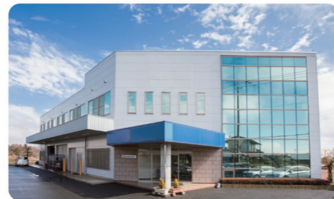
茨城県を中心に全国に向けて情報発信しています