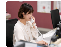
みなさんの就職活動を応援しています!

元々物流志望ではなかったのですが、インターンシップで人事採用担当者の優しい人柄に惹かれたのが志望のかっけです。センター見学の際、各センターの方が気さくに声を掛けてくれたこともとても好印象でした。採用担当になった今、私が受けた時のように学生の皆さんに寄り添う採用活動を行っています!