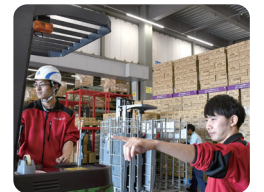
若手にチャンスを与えてくれるため活躍できる場が充実しています!

関東一円に34店舗を有する大手食品スーパーの専用センターで、商品管理を行っています。商品の入荷や注文を受けた商品の出荷など1日で平均1~2万点を管理します。当社は若手の活躍を応援してくれる社風であり、自分自身も入社6年目で副センター長を務めています。キャリアが上がるほど、多方面にやりがいを感じる仕事です。