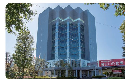
本社からは筑波山や、時には富士山が見えることも