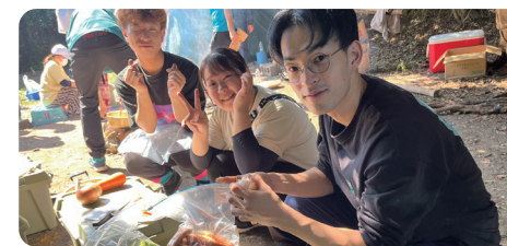
座学研修のみならず、仲間を大切にするチームビルディングなど、多様な研修制度が充実しています

現在は新事業の立ち上げや新拠点の開設に伴い、新たなポストも続々誕生しており、早い段階から責任ある仕事に挑戦する事も可能です。