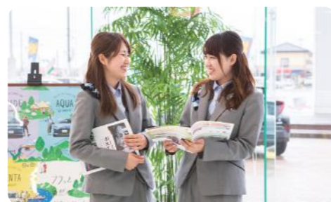
スタッフ同士の関係も良好で明るい雰囲気