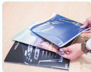
お客様が安心できるカーライフをご案内します