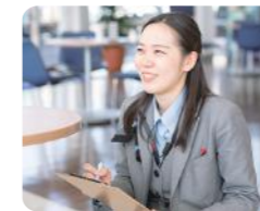
電話対応や見積り作成なども担当しています♪

地元で働きたいという思いから、地域密着の活動をしている点に惹かれて入社しました。店舗スタッフは仲が良く、アットホームな雰囲気。お客様に喜んでいただけることや、感謝の言葉をいただけることは、大きなやりがいです。これからも、お客様がまた来くなるようなお店づくりをしていきたいです。