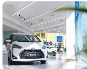
太陽の光が差し明るいフロア

お客様の笑顔が一番のやりがい。クルマが好きな人はもちろん、人と話すのが好きな人、地元で働きたい人が一緒に働く職場です！