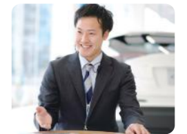
お客様を深く知るためにも対話が大切！

元々人と接する仕事がしたくて、自分もトヨタ車に乗っていたことからこの仕事に興味を持ちました。ご成約を頂いたときの達成感や、お客様から喜びの声を聞いたときの嬉しさは最高です。営業の仕事はお客様との関係性づくりが大切。直接お話しする機会を増やし、密なコミュニケーションを心掛けています。