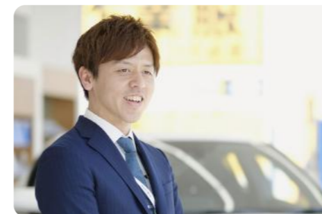
地域密着型でクルマの魅力を発信します

全国に広がるトヨタブランドを掲げながら、スタッフを第一に考える当社。仕事のやりがいと人生の幸せの両方を追求できる職場です。