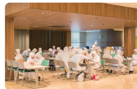
開放的で洒落な休憩室は好評です!

お客様だけでなく、社員や地域の皆様も「幸せ」にすることが当社の理念。いきいきと働ける環境づくりのため、本社工場には心身共にリフレッシュできる休憩室を備えました。現金支給の特別賞与や年末のA5ランク牛肉プレゼントなど「お楽しみ」も充実!近隣の清掃活動など、地域貢献にも積極的です。