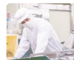
上司や同僚など皆が仲良く、本場に雰囲気の良い会社です!

元々、学生時代に食品関係や農業について勉強していたこともあり、地元の野菜を使った食品メーカーである旭物産に興味を持ちました。伸び続けている業績や自分が入社する直前に完成した最新鋭の本社新工場に感動し、自分も旭物産に急成長の波に貢献したいと思い、入社を決めました!