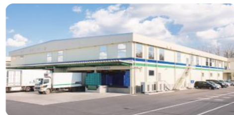
本社及び本社工場

【本社及び本社工場】 茨城県水戸市高田町127 【鉾田工場】 茨城県鉾田市秋山644-3 【小美玉工場】 茨城県小美玉市先後653-1