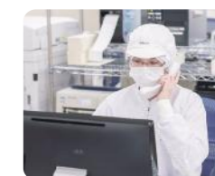
チームや他部署とのコミュニケーションも大切な仕事です!

私は商品の受注に関する仕事をしています。メールや電話などさまざまな形式で来る注文をPCに入力し、伝票の出力や現場で使用する製造指示書の作成を行っています。私たちの部署の仕事によって現場での製造数量が決まるので緊張感もありますが、その分やりがいのある仕事だと思っています。